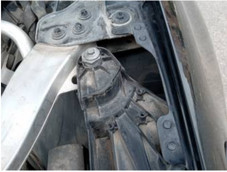
Phare avant gauche (Défaut aspect)